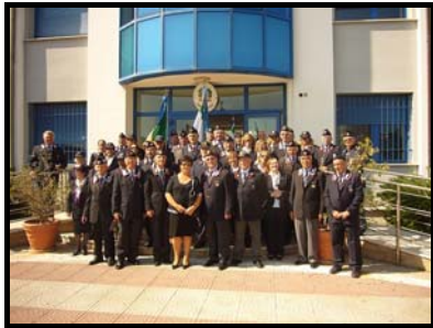
11-09-2010 San Benedetto del Tronto