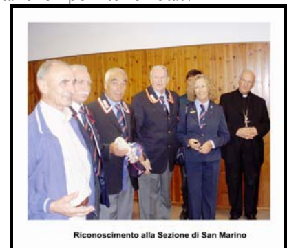
Riconoscimento alla Sezione di San Marino