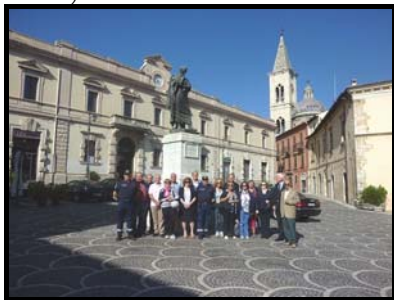
12-09-2010 Sulmona – Monumento ad Ovidio