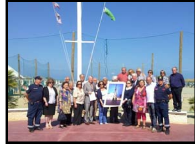
12-09-2010 Pescara – Lido del Carabiniere