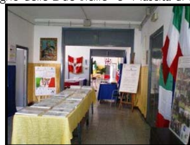
Bolsena: scuola primaria

Ogni mostra ha sviluppato un momento specifico del nostro "Risorgimento", ad Orvieto è stata allestita su "Le battaglie per l'indipendenza, dalle pianure lombarde all'Italia Centrale", mentre a Bolsena e Tuscania le mostre hanno riguardato "Garibaldi, i Mille e il Regno delle Due Sicilie" e "Nascita di una Nazione"