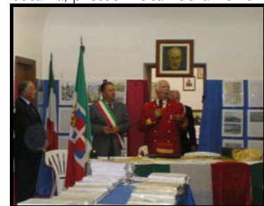
Tuscania: Sezione ANC. Presenti il Sindaco e l'ispettore reg."Lazio"

L'evento che ha riscosso molto successo di pubblico si è articolato su tre sedi: ad Orvieto, presso la sala degli Archi del Palazzo dei Sette; a Bolsena, presso il Salone della ex scuola Primaria ed a Tuscania, presso i locali della Sezione ANC