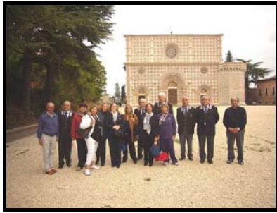
10-09-2010 L'Aquila – Basilica di Collemaggio

10, 11 e 12 settembre 2010: Tour della delegazione modenese-sanmarinese a L'Aquila, San Benedetto del Tronto, Sulmona e Pescara