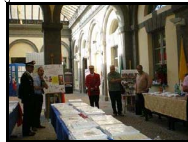
Orvieto: Palazzo dei Sette

Come preannunciato sul n° 1 d'Informasaggi il 15 luglio u.s. in Orvieto presso il "Palazzo dei Sette" ha avuto luogo l'inaugurazione della mostra storico-iconografica "Aspettando il 2011 ... 150° Unità d'Italia". Tra i vari componenti del Comitato d'onore, l'Arma era rappresentata dai Generali Umberto Rocca MOVIM, Amaldo Grilli e Giuseppe Richero, mentre fra gli enti patrocinatori figurava il Museo Storico dell'Arma