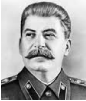
G. Stalin: 1879-1953

VITA E DESTINO di Vasily Grossman (1905 - 1964) Adelphi Edizioni, Milano, 2008, pagg. 827