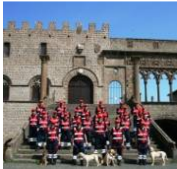
(Nucleo di Protezione Civile di Viterbo)

Questo tormentato momento della vita nazionale, nel quale si assiste alla trasformazione dei valori tradizionali, non deve essere vissuto con angoscia bensì deve sollecitare ad una partecipazione solidaristica attiva e consapevole che si traduca in proposte e progetti. Per realizzare questo, bisogna impegnarsi a dare un senso alla vita di ogni giorno con gioia ed entusiasmo, cercando di allargare l'ambito dei propri interessi.